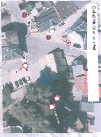
Detail Malého náměstí