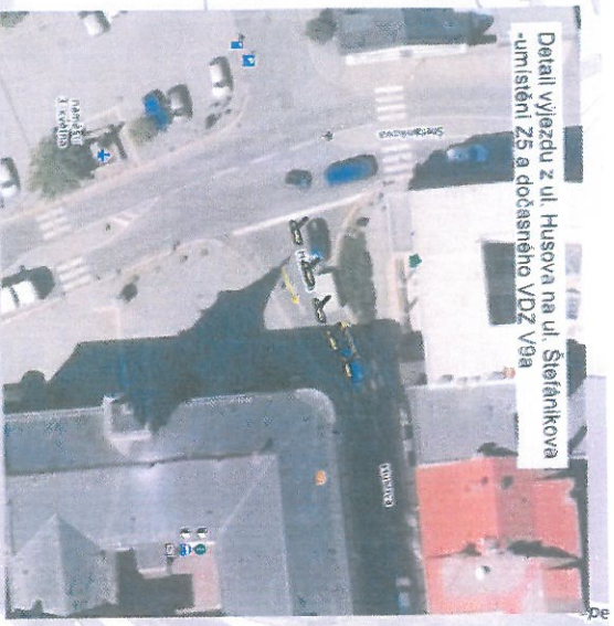
Detail výjezdu z ul. Husova na ul. Štefánikova - umístění Z5 a dočasného VDZ V9a