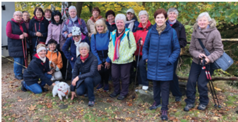
SZdP Železnobrodská, Šlápoty, str. 37