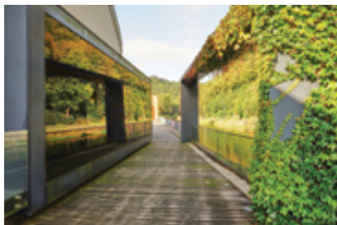
Městská galerie Vl. Rady, Vítězná fotografie z kategorie Krásy města a okolí, str. 14