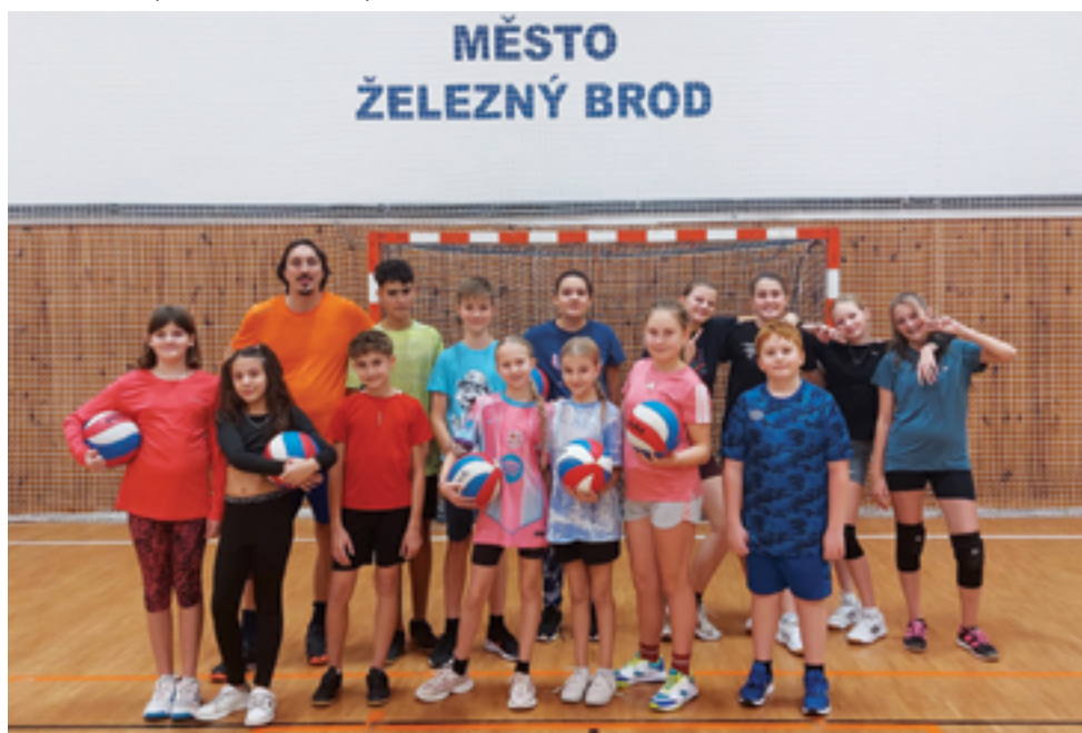
TJ Sokol Železný Brod, volejbalový oddíl, str. 44