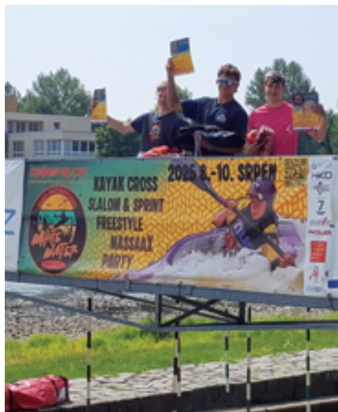
Klub kanoistiky Železný Brod, Vítězné závodu, str. 42