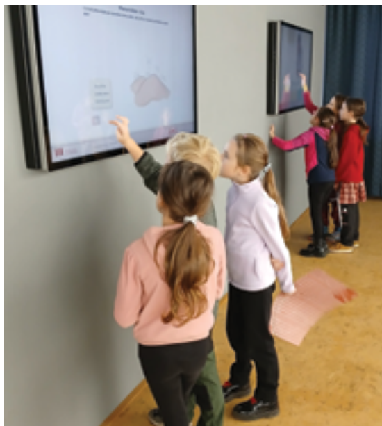
Městské muzeum v Železném Brodě, Malí objevitelé skla, str. 19