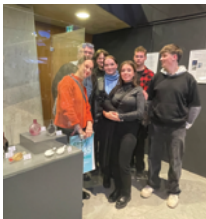
SUPŠ sklářská, Exkurze, str. 32.