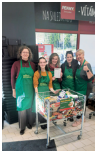
MěÚ Železný Brod, Odbor sociálních věcí, Potravinová sbírka, str. 6