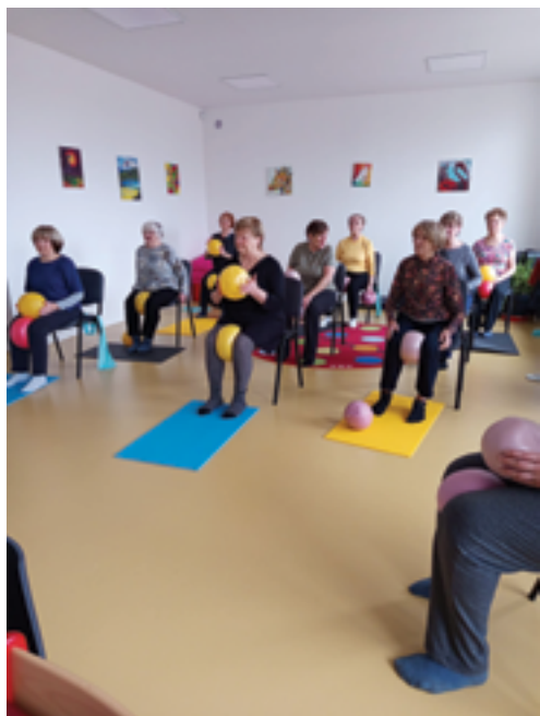
SVČ Mozika, Cvičení na Hrubé Horce, str. 32.