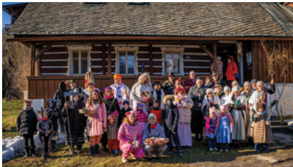
RC Andílek Železný Brod, Masopust „po staru“ 15. 2. 2026