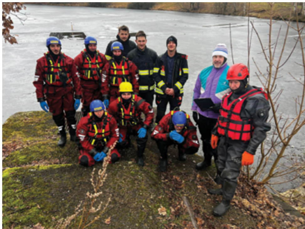
SDH Železný Brod, Výchvík, str. 41.