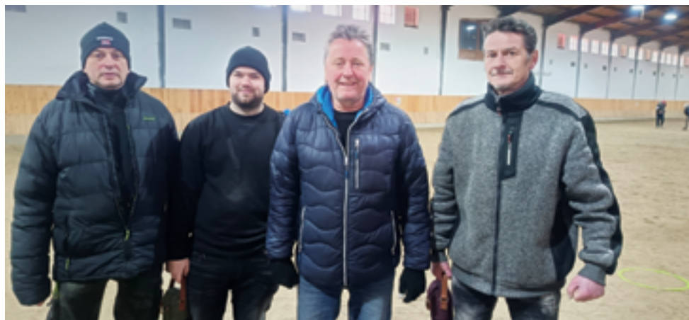
Petanque Klub Železný Brod, Turnaj v jízdárně, str. 40.