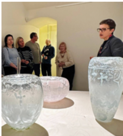
SUPŠS, Komentovaná prohlídka výstavy