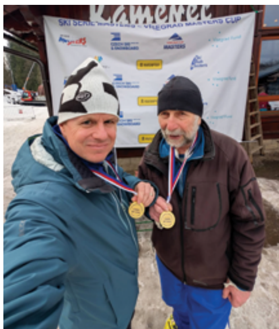
TJ Sokol Železný Brod, Lyžařské závody, str. 38.