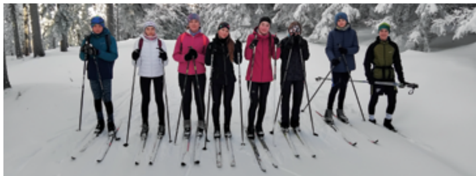
ZŠ Pelechovská, Lyžařský výcvik, str. 29.