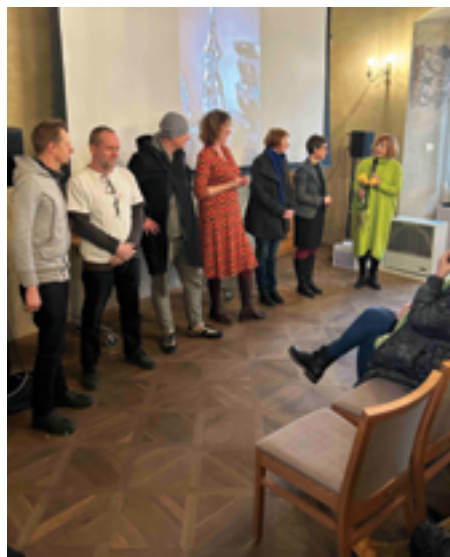
SUPŠS, Vernisáž výstavy, str. 30.