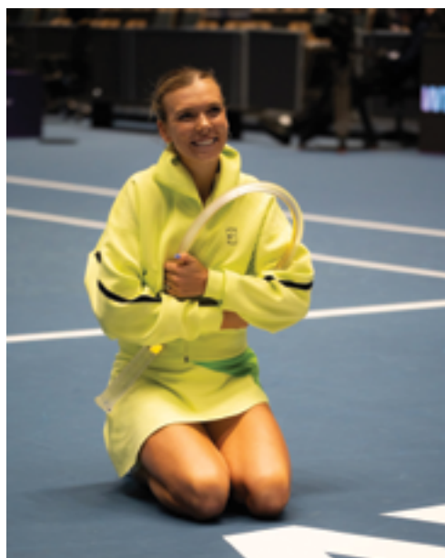
Halama Glass Žel. Brod, Cena pro vítězku, str. 42.