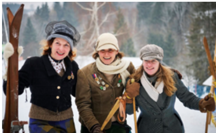
TJ Sokol Železný Brod, Lyžařské závody, str. 38.