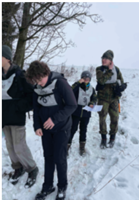
Skautské středisko Údolí Železný Brod, Závody, str. 36.