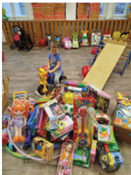
RC Andílek, Nadílka hraček, str. 36.