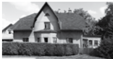
Dům čp. 10, vlevo leptárna, vpravo lázně

Po zániku lázní se místnost využívala pro potřeby obce křesťanské, jejíž učení na Pelechov přivedl pan Nejedlo. Možná právě pro ně stavení čp. 10 se sousední tzv. leptárnou – protáhlou budovou na straně k ŽB – v roce 1926 postavil. Lázně byly umístěny