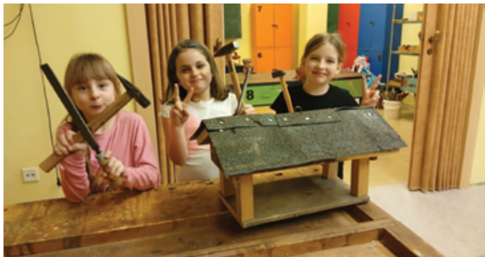
Skautské středisko Údolí, zimní činnosti, str. 37