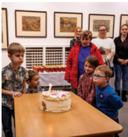
RC Andílek Železný Brod, karneval Tlapková patrola v roce 2023, Výstava 10 let RC Andílek, str. 46