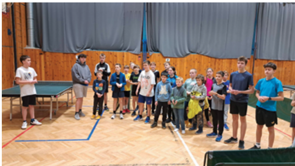
TJ Sokol Železný Brod, Oddíl stolního tenisu, str. 41