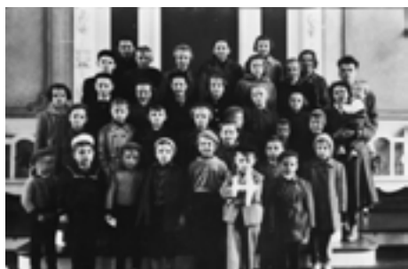
ČCE, Poznáte se na fotografiích, str. 35