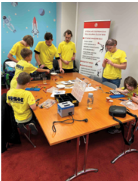
SUPŠ sklářská, T-Profi, str. 31