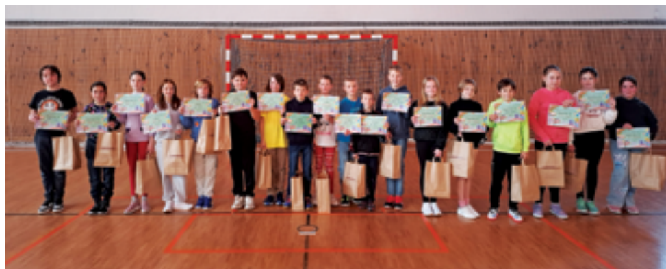
ZŠ Školní, Matematická soutěž, str. 29