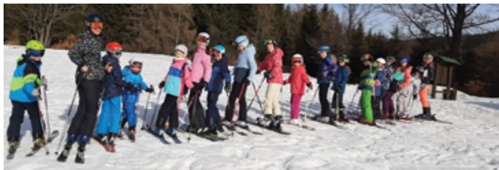
SVČ Mozaika, Účastníci loňského ročníku lyžařského tábora, str. 33