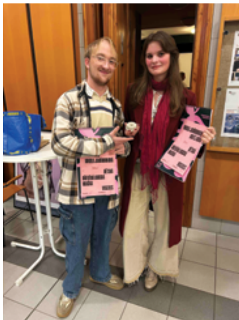
SUPŠS Železný Brod, Slavnostní předávání cen, str. 30