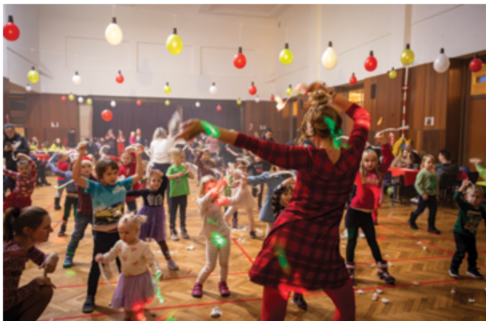
RC Andělek, Vánoční akce, str. 38