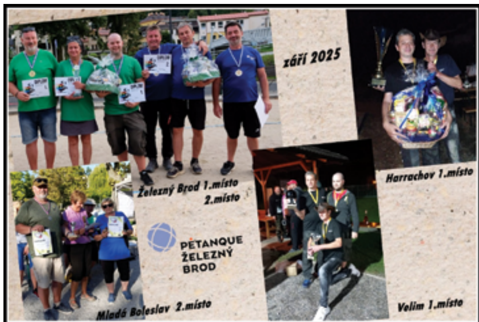
Petanque klub, Vítězné turnajů, str. 39