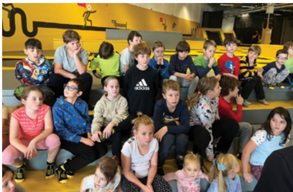
Skautské středisko údolí, Výlet, str. 37