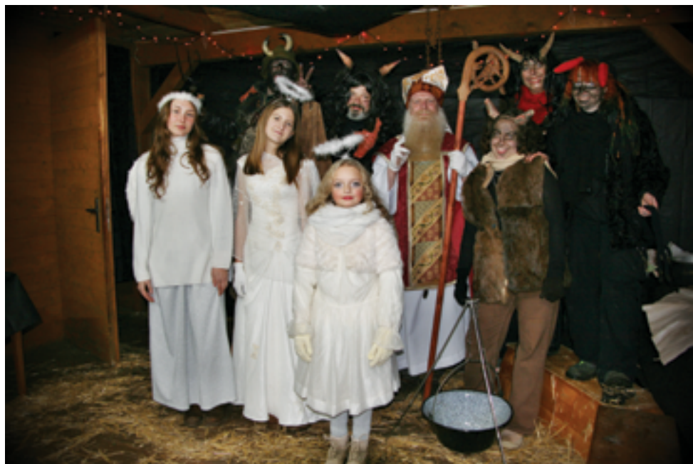
SVČ Mozaika, Peklo, str. 33