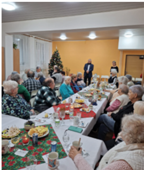
DPS Železný Brod, Vánoční setkání, str. 6