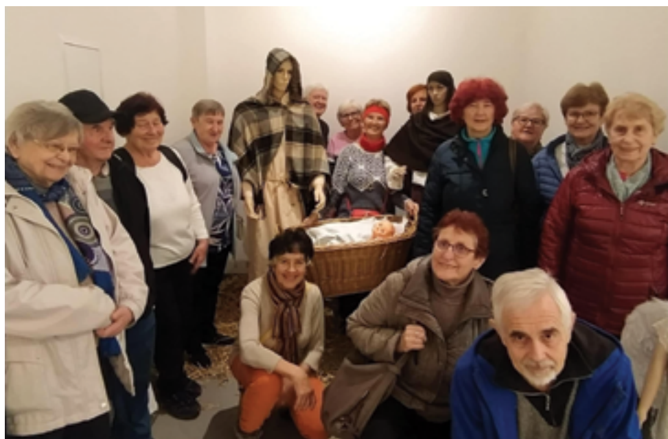
SZdP Železnobrodská, Šlápoty, str. 37