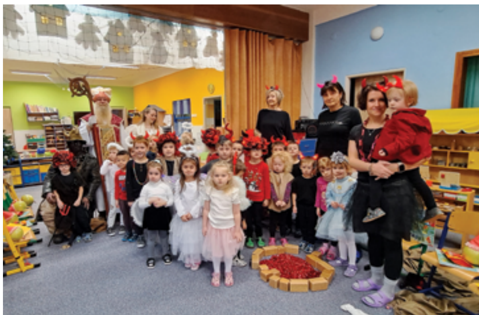
MŠ Na Vápence, Mikulášská nadílka, str. 27