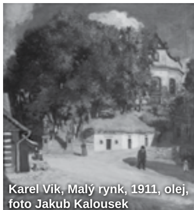
Karel Vik, Malý rynek, 1911, olej