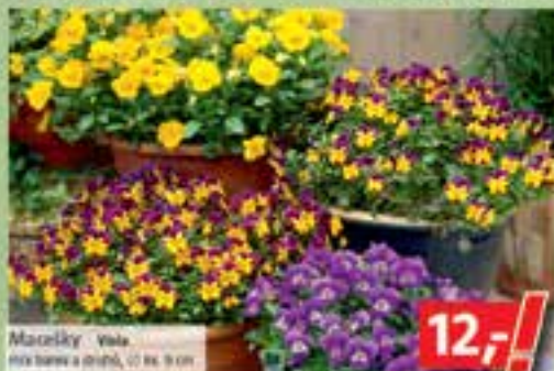
Macečky vala mix barva a druh, 10 ks, 9 cm