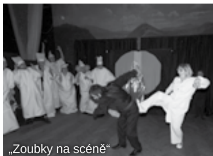
„Zoubky na scéně“

Dozvíte se, jak to dopadne, když se o zoubky nepečuje tak, jak by mělo. Vhodné pro děti od tří let i pro dospělé, kteří s rádi baví.