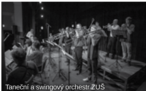
Taneční a swingový orchestr ZUŠ

V listopadu máte možnost naše žáky vidět a slyšet ještě na dalších akcích. Taneční a swingový orchestr ZUŠ Železný Brod si budete moci poslechnout v pátek 27. listopadu na Rozsvícení vánočního stromu a také v pátek 13. listopadu na Swingovém večeru v Městském divadle. Nejstarší soubor LDO – KUKI-KUKI se s improvizáčním vystoupením zúčastní Noci divadel 21. listopadu. Žestový soubor doprovodí děti z mateřských škol při Rozsvícení vánočního stromu. Těšíme se na Vaši účast.