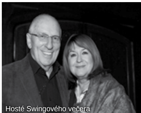
Hosté Swingového večera