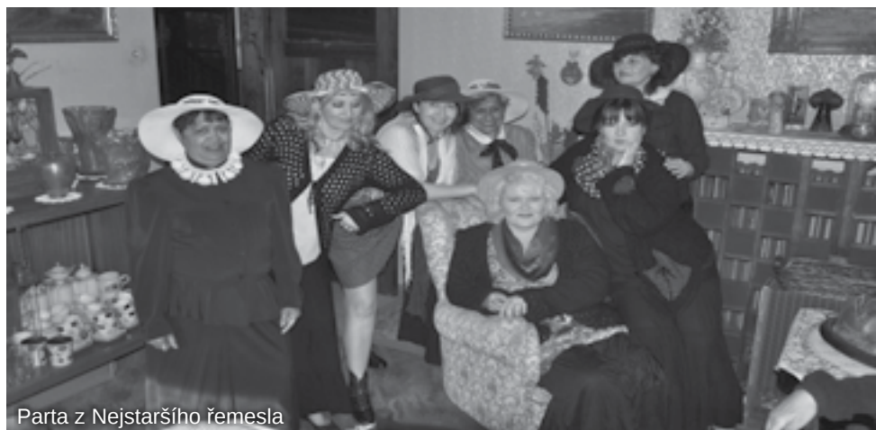
Parta z Nejstaršího řemesla

Vstup volný (od 20 hodin nepříliš vhodně pro děti)