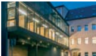
Zrekonstruovaný dům U páva zaujal porotu ze všech nejvíce.

Hlavní cenu soutěže Stavba roku Libereckého kraje získala rekonstrukce domu U páva v ulici 8. března v Liberci. Svým hlasováním se do soutěže zapojila i veřejnost. Tu nejvíce zaujala obnova vyhlídkové terasy u kaple ve Vranově u Malé Skály a získala tak Cenu sympatie občanů Libereckého kraje. „Vítězství v letošním ročníku si rekonstrukce domu U páva rozhodně zaslouží. Je to ukázkou propojení historického domu s moderní přístavbou. Podařilo se zde zachovat a zrenovovat řadu historických detailů, které jsou citlivě sladěny s moderními funkčními prvky,“ vyzdvihl člen rady kraje Vít Příkaský, který je současně předsedou poroty.