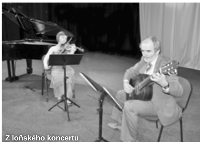
Z loňského koncertu

Vstupné dobrovolné Pořádá ZUŠ Železný Brod