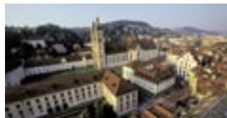
St. Gallen.

Švýcarský kanton St. Gallen je nejvýznamnějším partnerem Libereckého kraje. S jakým dalším regionem by se měl náš kraj snažit navázat podobně úzkou a bohatou spolupráci?