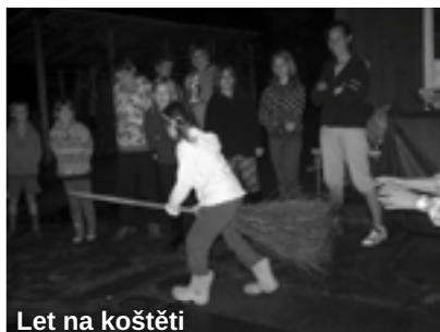
Let na koštěti

Bližší informace v DDM Mozaika, na www.ddmzb.cz nebo tel. 483 389 396