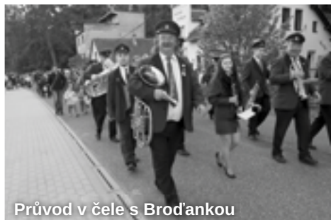
Průvod v čele s Broďankou