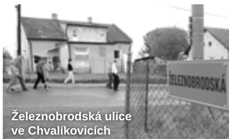
Železnobrodská ulice ve Chvalíkovcích