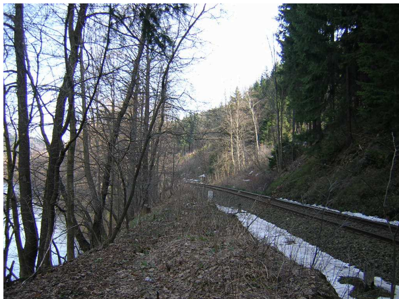
Stávající pěšina podél železniční trati