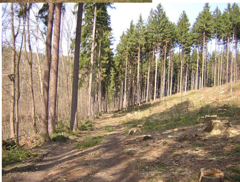
Nezpevněný úsek cesty podél náhonu - Líšný