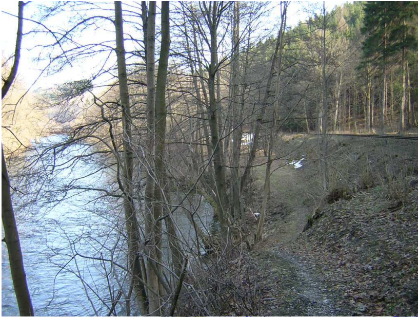
Stávající pěšina podél železniční trati