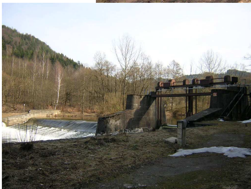
Jez na Jizeře - Splzov