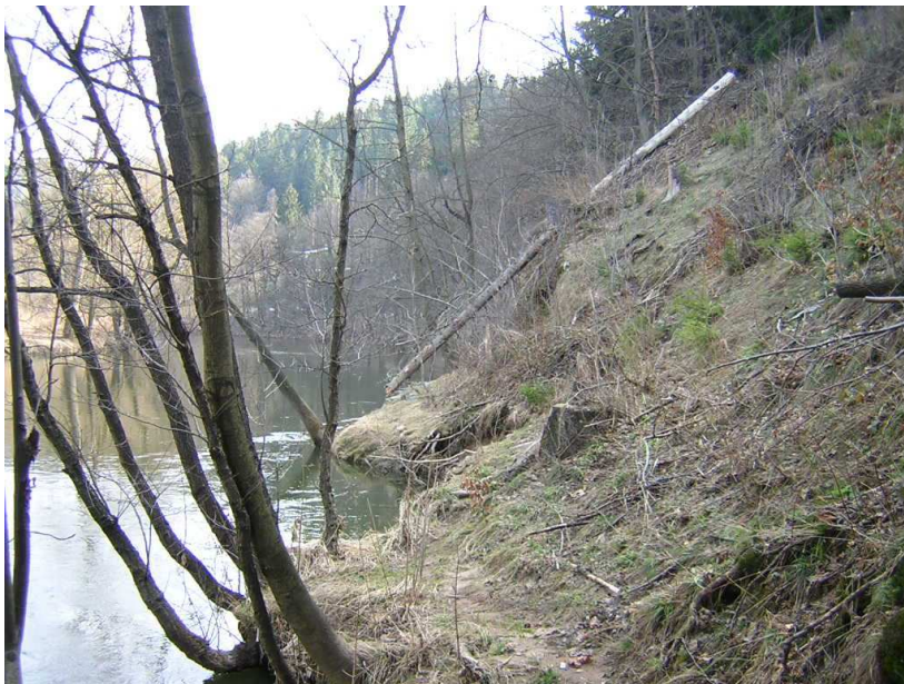
Problematický úsek od jezu ke konci železničního tunelu