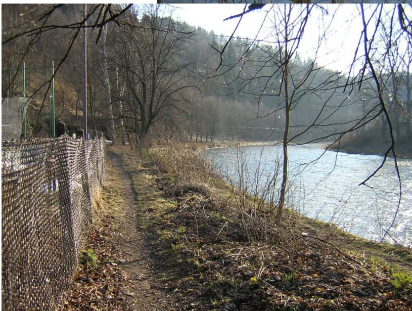
Vjezd do Železného Brodu – pohled zpět