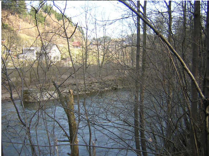
Pohled přes Jizeru na začátku Železného Brodu