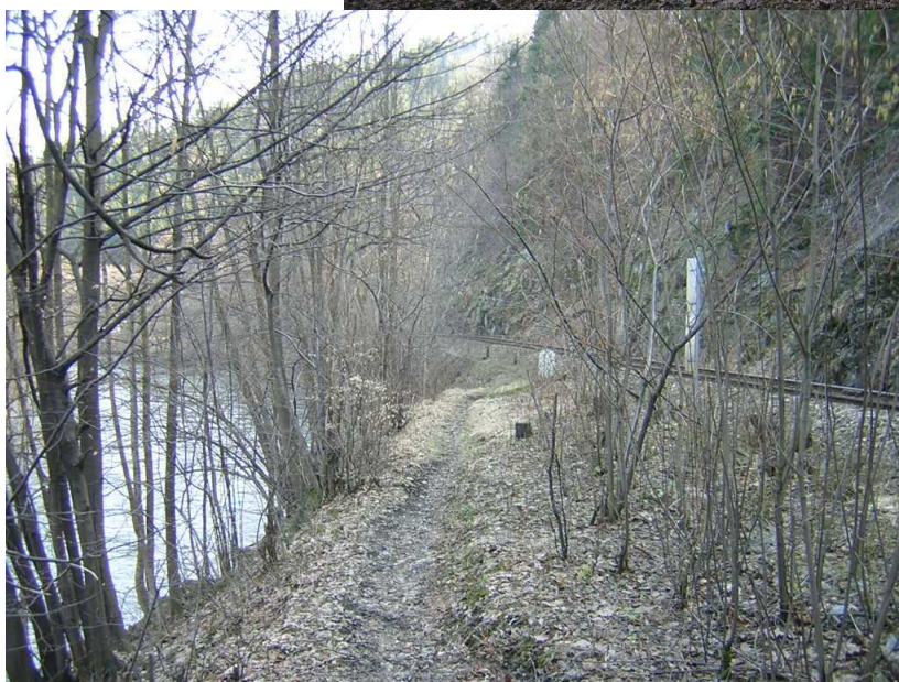
Stávající pěšina podél železniční trati – pohled na první „úzké“ místo