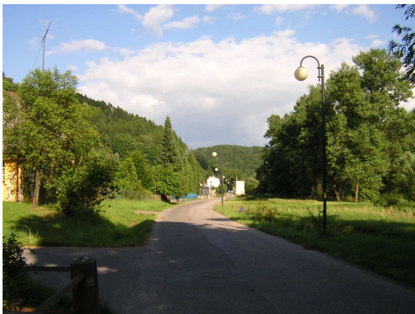
Železný Brod - průjezd kolem koupaliště